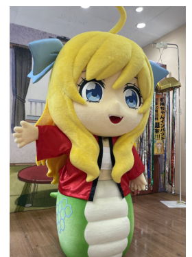
邪神ちゃんインパクト