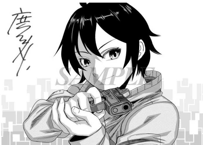
イラスト/広江礼威

合本版 1 巻目に、人気マンガ『ブラック・ラグーン』『341 戦闘団』の作者・広江礼威先生の描き下ろしイラストを掲載しております。広江先生が特別に描き下ろした貴重なイラストを、応援コメントとともに楽しみいただけます。