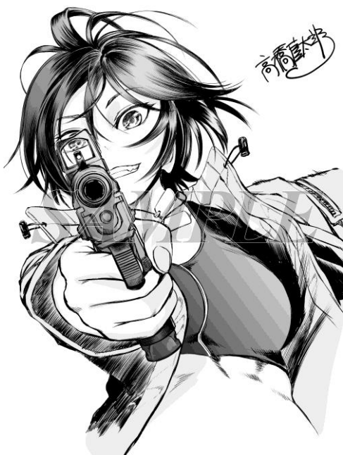
イラスト/高橋慶太郎

合本版 2 巻目には、人気マンガ『ヨルムンガンド』『デストロ 016』の作者・高橋慶太郎先生の描き下ろしイラストを掲載しております。高橋先生ならではのタッチで描いた特別なイラストを、応援コメントとともに楽しみください。