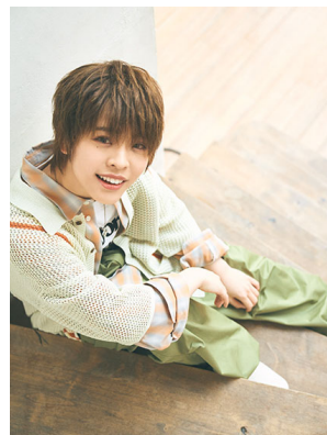
< 天堂 太陽 >